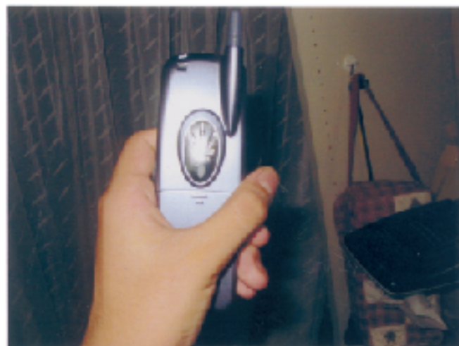
携帯電話に付いている機能として発光やバイプレーターがあります (写真は tu-ka)